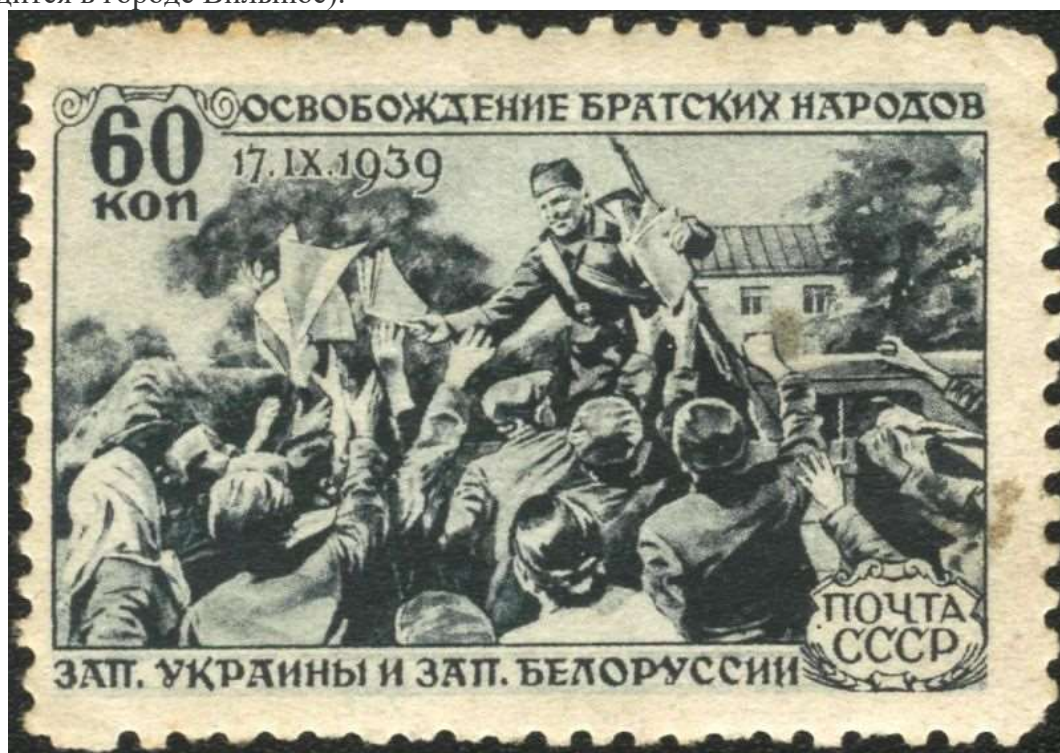
Марка СССР «Освобождение братских народов Зап. Украины и Зап. Белоруссии». 1940

1 сентября 1939 г. началась Вторая мировая война . Германия вторглась в Польшу, Англия и Франция поддержали поляков и объявили войну Германии. 17 сентября, когда польское правительство уже покинуло территорию Польши, Красная армия получила приказ ввести войска на территорию Западной Белоруссии и Украины. Советские войска практически не встретили сопротивления и, выйдя на условленные по соглашению с Германией рубежи, остановили продвижение немецких войск на восток. 27 сентября был подписан Германско-советский договор о дружбе и границе, определивший демаркацию границ между СССР и нацистской Германией. Западная Белоруссия вошла в состав Белорусской ССР, а Западная Украина — в состав Украинской ССР, Виленский край был передан Литве (теперь столица Литвы находится в городе Вильнюс).