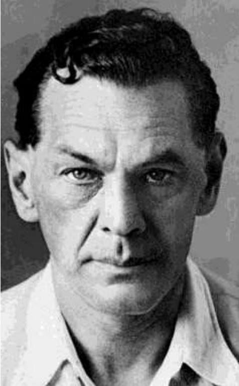
Рихард Зорге.

тем самым все боеспособные силы в приграничном сражении. Конечно, целью немцев было выйти на линию Астрахань — Волга — Архангельск, с которой при необходимости германские ВВС могли наносить удары по советской промышленности на Урале. Для реализации плана Германия выделила более 150 дивизий, в том числе 19 танковых и 14 моторизованных. Её союзники также обязались предоставить определённый контингент. В общей численности Германия и её сателлиты выставляли для войны с СССР более 190 дивизий (свыше 5 млн чел.), около 50 тыс. орудий и миномётов, более 4 тыс. танков и штурмовых орудий и столько же боевой авиации. Советская группировка на западе страны составляла лишь 170 дивизий (около 3 млн чел.), порядка 40 тыс. орудий и миномётов, более 11 тыс. танков и около 9 тыс. самолётов. Начать вторжение планировалось 15 мая 1941 г., продолжительность боевых действий должна была составить пять-шесть месяцев. 10 июня 1941 г. был подписан приказ о нападении. После этого разведчики направили в Москву информацию о времени нападения. Среди них был и выдающийся советский разведчик Рихард Зорге (1895–1944). Надо отметить, что в этих сообщениях приводились самые разнообразные данные о том, когда начнётся война: в апреле, июне, а затем и летом 1942 г.