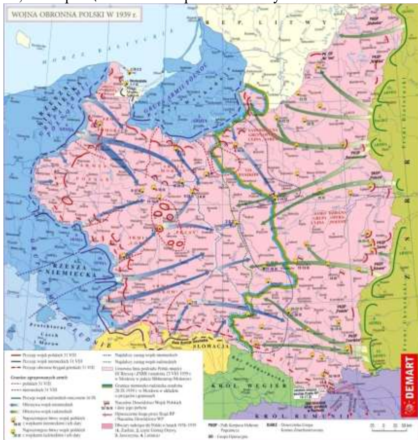
Рис. 2. 1939 г., войскам РККА был

Из опубликованных ныне документов видно, что Советский Союз не вмешивался в происходящее до тех пор, пока сохранялись хотя бы малейшие шансы на то, что Польша сумеет продолжить борьбу, либо на то, что Франция и Великобритания начнут полномасштабные действия против Германии.