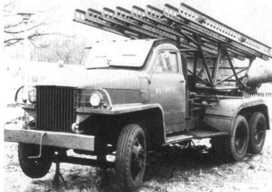
Рис. 6. Т-34, КВ и «Катюша»

6. Развитие производства артиллерийского оружия (июнь 1941 г. — запуск производства ракетных установок «Катюша» БМ-13) (рис. 6).