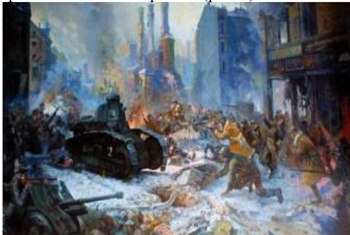
Рис. 3. «Взятие Выборга Красной Армией» А. А.

11 февраля 1940 г. начался заключительный этап войны. Советские войска перешли в наступление и прорвали линию Маннергейма (рис. 3).