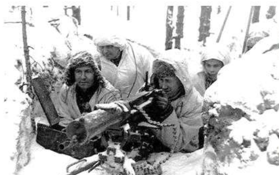
Рис. 4. Ноябрь 1939 — март 1940 гг. Советско-финская война

Цена победы в «зимней войне» оказалась исключительно высока. Помимо того, что Советский Союз как «государство-агрессор» был исключен из Лиги Наций, в ходе 105 дней войны РККА потеряла не менее 127 тыс. человек убитыми, умершими от ран и пропавшими без вести. Около 250 тыс. военнослужащих было ранено, обморожено, контужено.